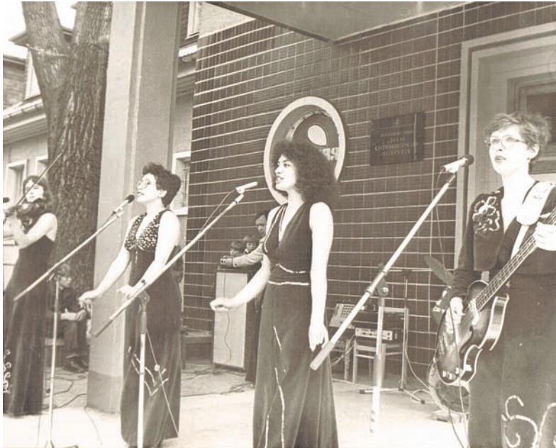
ВИА «Моряна» выступает с концертом на крыльце Дома офицеров, 1983 год.