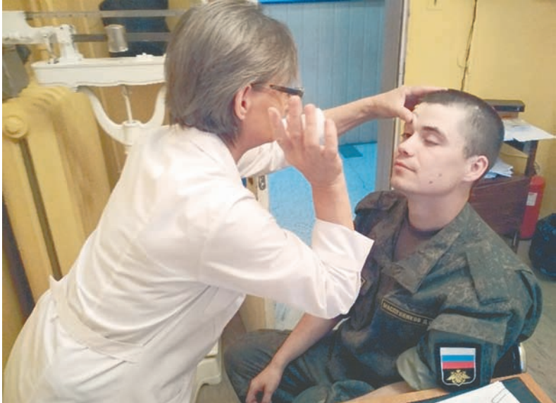
Ежедневный осмотр военнослужащих.