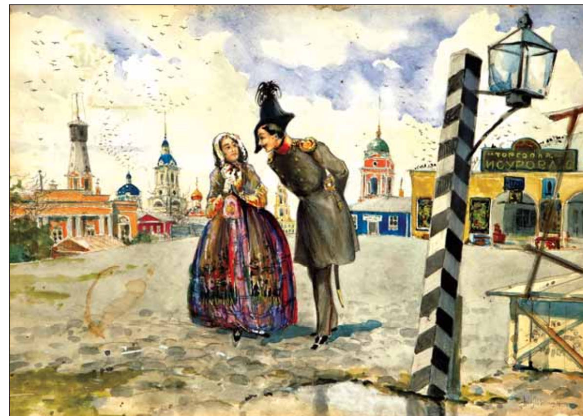
В провинции (Торговая площадь в Костроме — атрибутировано К. Н. Степановым). Бумага на картоне, акварель, белила, графитный карандаш, цветные мелки. 1900-е годы. Пермская государственная художественная галерея