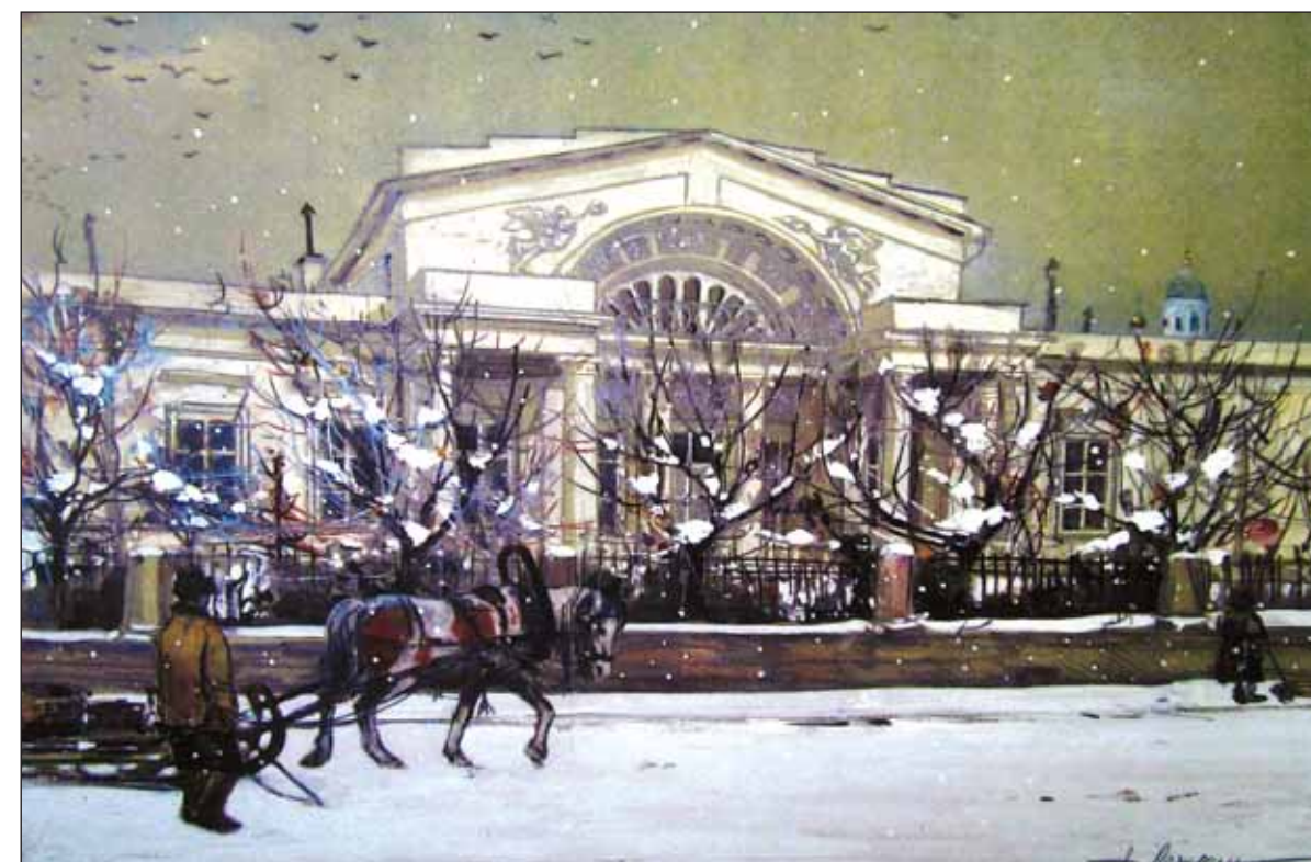
Дом князя Гагарина на Новинском бульваре (Москва, не сохранился). Бумага, акварель, белила. 1916 год