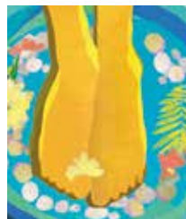
Рисунок на обложке: Dollaphotoclub.com