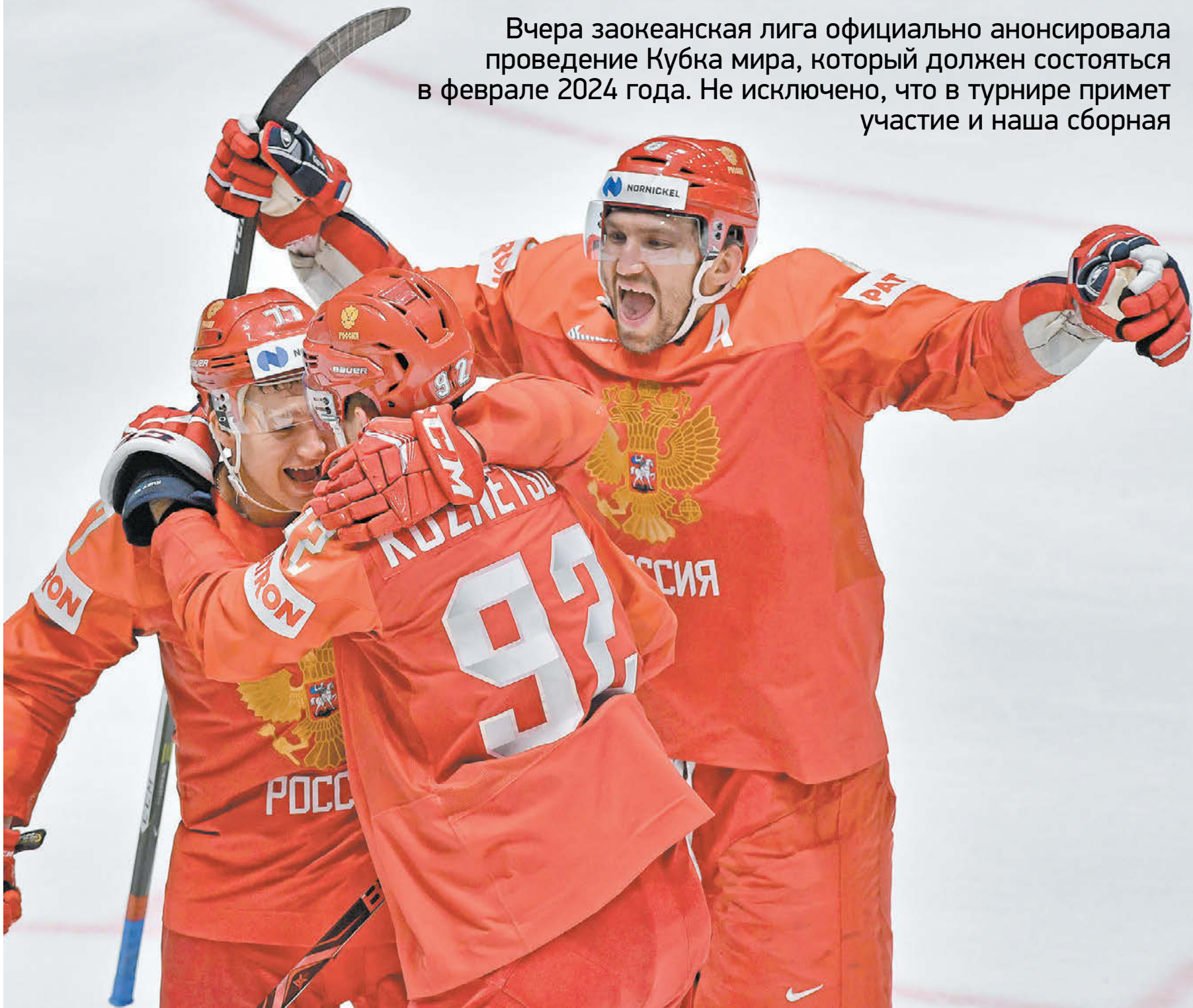
Кирилл Капризов, Евгений Кузнецов и Александр Овечкин в составе сборной России

Вчера заокеанская лига официально анонсировала проведение Кубка мира, который должен состояться в феврале 2024 года. Не исключено, что в турнире примет участие и наша сборная