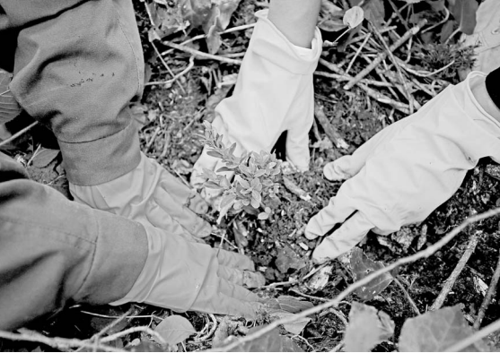
Леса региона ждет пополнение.

Годовой план выполнен: в лесных питомниках и теплицах Вологодской области посажены будущие елочки и сосны. Посевные площади заняли 12,8 гектара. В этом сезоне специалисты использовали новую технику и оборудование, приобретенное в рамках регионального проекта «Сохранение лесов» национального проекта «Экология». Ежегодно в Вологодской области выращивают 20 миллионов сеянцев хвойных пород. Для этого на территории региона создано более 100 питомников. Их площадь для производства посадочного материала составляет 51,3 гектара.