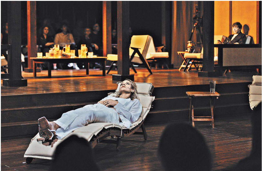
«Дачники на Бали, или «Асса» 30 лет спустя» в первую очередь спектакль о сегодня и нас, нынешних.

Это цитата из статьи Константина Богомолова «Я умру, а вы останетесь?», посвященной новым эмигрантам. Она была опубликована незадолго до премьеры спектакля «Дачники на Бали, или «Асса» 30 лет спустя». О том, какой получилась новая работа режиссера и почему она обещает споры, читайте на с. 10.