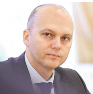
Алексей Беспрозанных, заместитель министра промышленности и торговли РФ

Как сообщила в декабре прошлого года заместитель министра экономического развития Татьяна Илюшниковна, экспертная комиссия продолжит работу, и в результате до конца 2024 года в России должно появиться не менее 20 новых промышленных парков и технопарков. В них будет как минимум 150 резидентов и 1 500 рабочих мест, а общая сумма привлеченных инвестиций составит не менее трех миллиардов рублей. ●