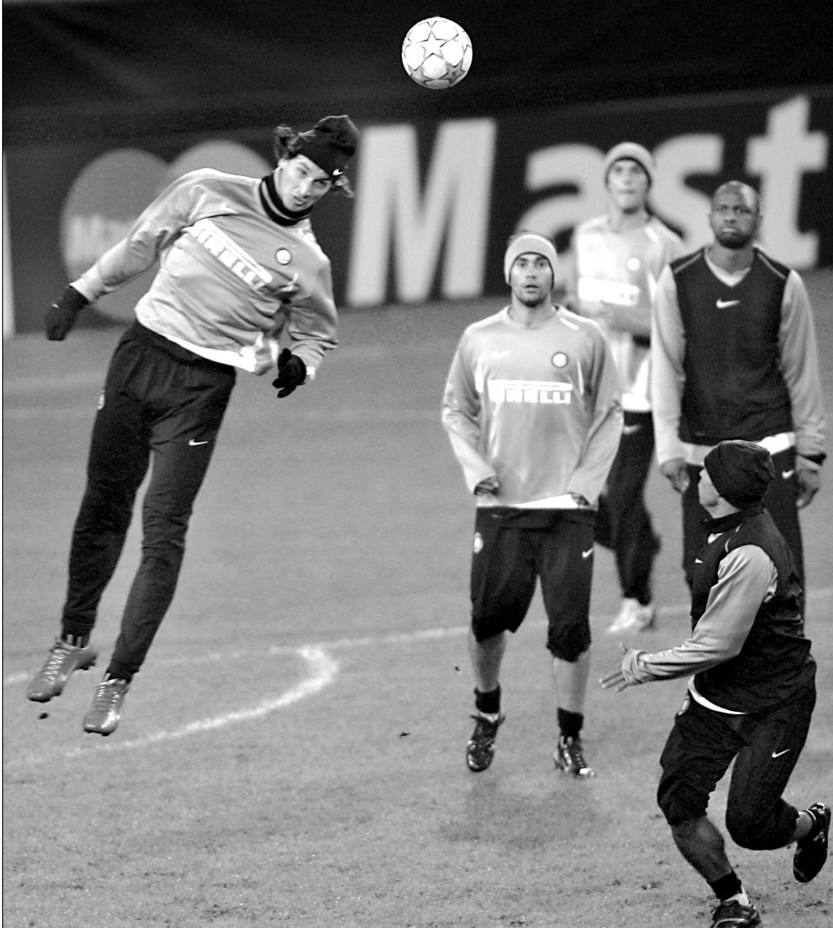
Вчера, Москва. Черкизово. Тренировка «Интера». Один из главных козырей итальянского клуба — Златан ИБРАГИМОВИЧ (слева).

— Подобные вещи трудно предсказать заранее, тем более когда встречаются две серьезные команды. И у меня, и у синьора Газзаева будет разрабатан определенный план на игру. Чей сработает? Об этом узнают болельщики, которые посмотрят матч на «Локомотиве». Уверен в одном — скучать ни не придется.