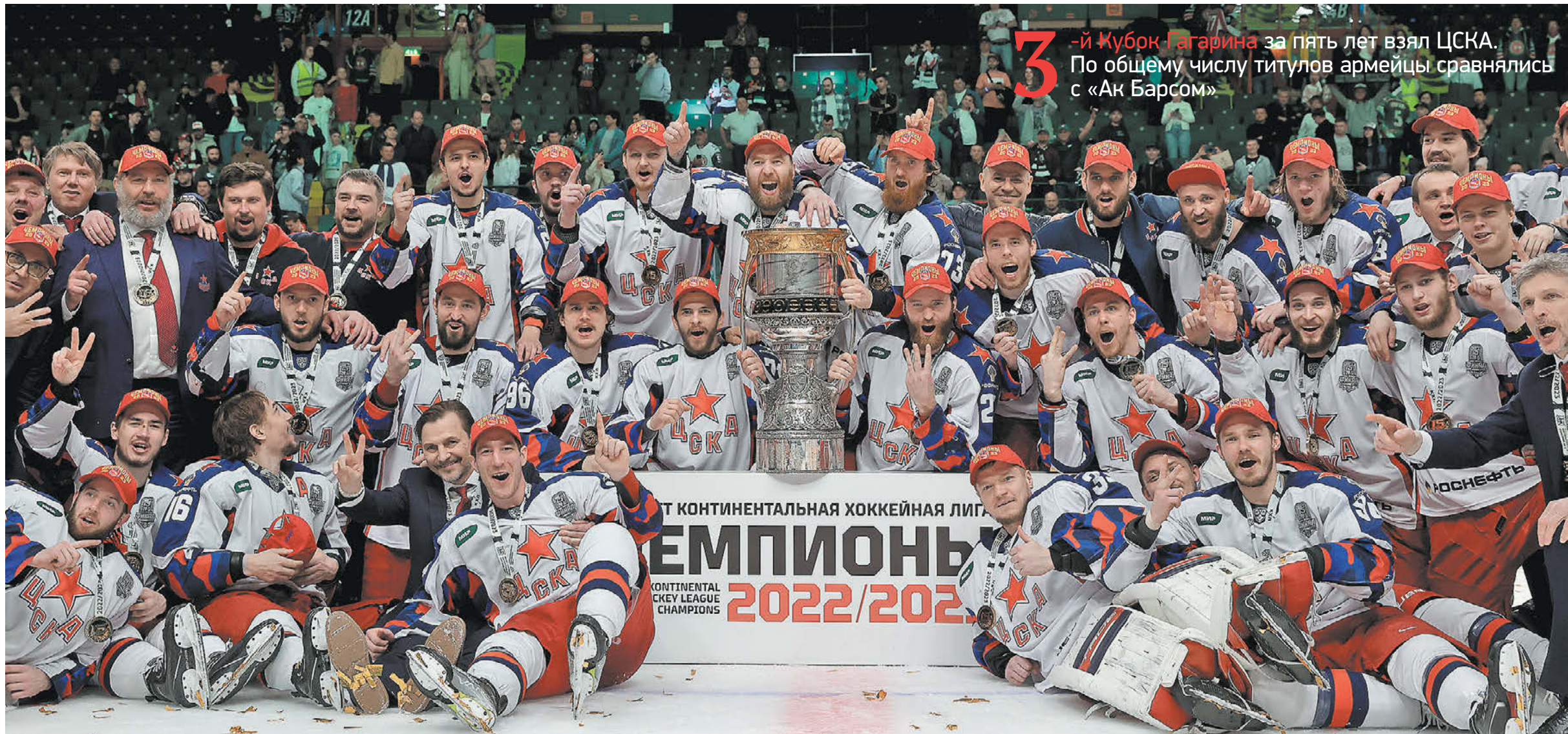
29 апреля. Казань. «Ак Барс» – ЦСКА – 2:3. Армейцы с Кубком Гагарина

29 апреля ЦСКА победил в Казани «Ак Барс» (3:2) и стал обладателем Кубка Гагарина-2023. Это второй подряд подобный успех красно-синих – в КХЛ, похоже, родилась команда-династия. Финальная серия продлилась все семь матчей – армейцы позволили казанцам сравнять счет, ведя 3–1. Но в решающий момент сказалась психология победителей москвичей и их стальной характер, ведь в субботу столичный клуб уступал по ходу встречи 0:1 и 1:2, однако переломил игру