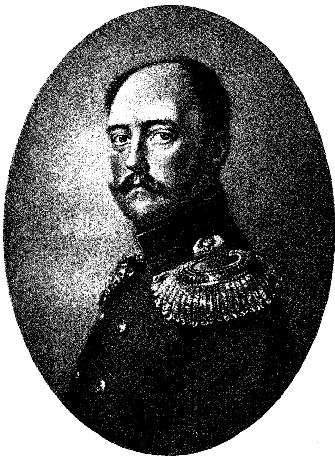
Императоръ Николай I, Августѣйшій Дѣдъ и Крестный Отецъ Императора Александра III.