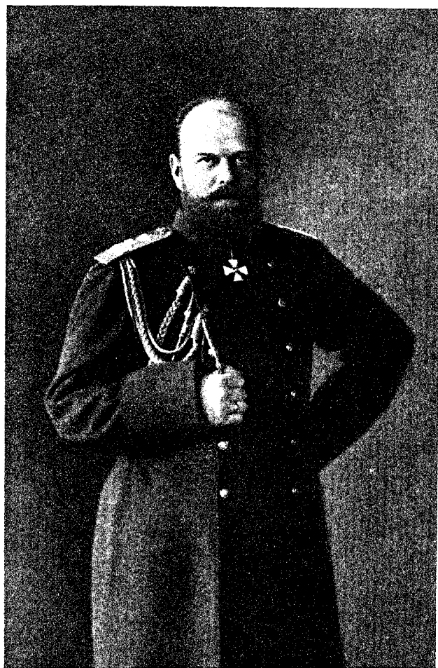
Императоръ Александръ III.