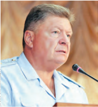
Последние пять лет Олег Торубаров занимал должность начальника ГУ МВД России по Алтайскому краю.