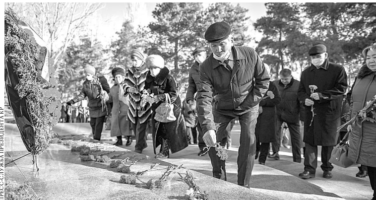
ПРЕСС-СЛУЖБА ПРЕЗИДЕНТА КР