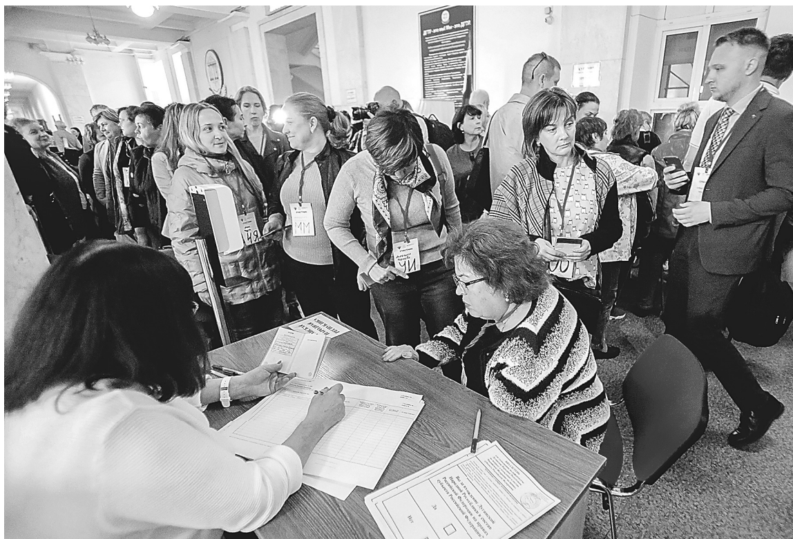
На референдуме жители освобожденных территорий поздравляли друг друга, обменивались новостями и планами на будущее.