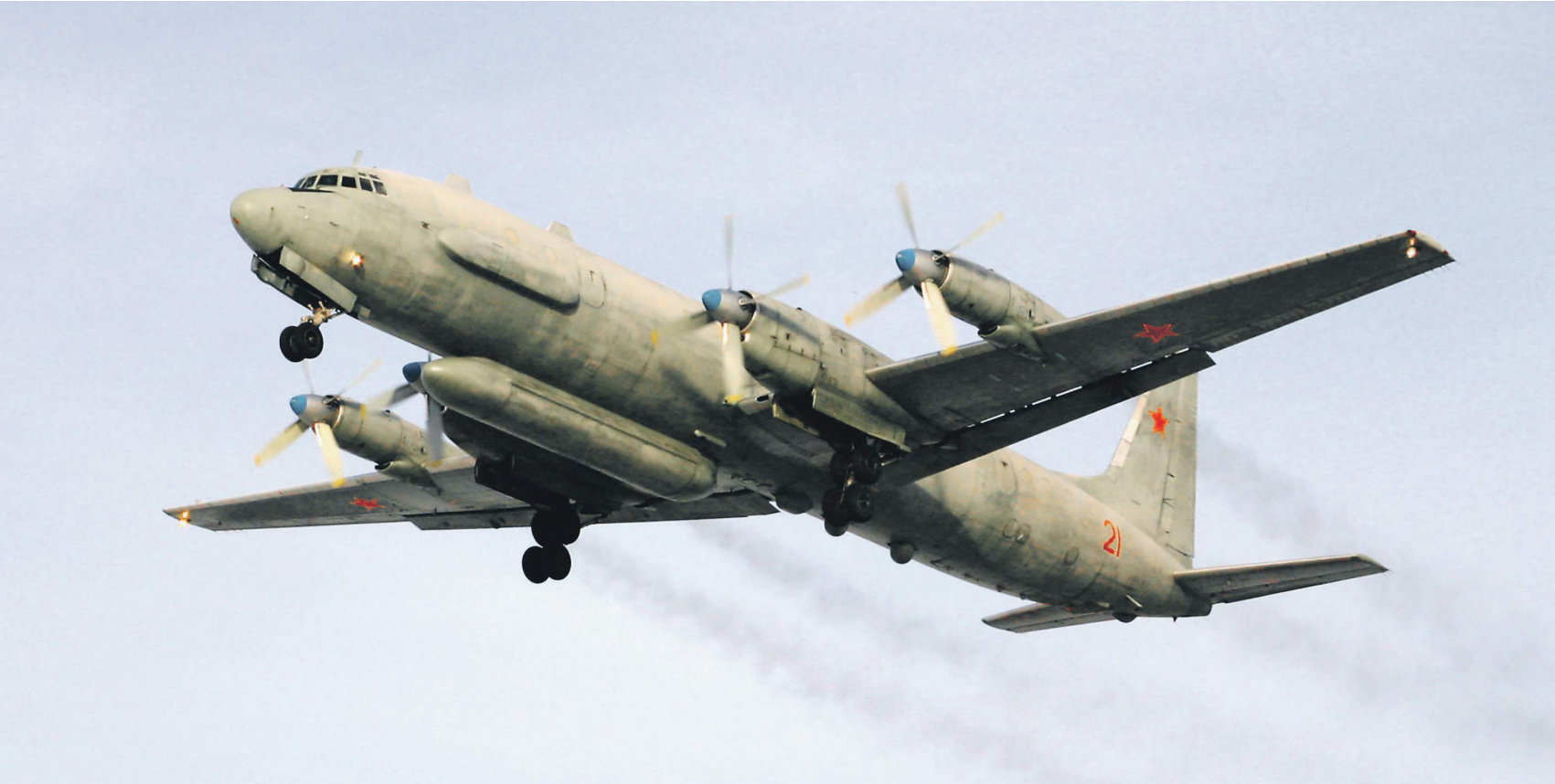
Трагедия в небе над Средиземным морем унесла жизни 15 человек

Владимир Путин выразил соболезнования близким погибших членов экипажа Ил-20. — Когда гибнут люди, особенно при таких трагических обстоятельствах, это всегда беда, беда для нас всех, для страны и для близких наших погибших товарищей, — заявил Владимир Путин в ходе пресс-конференции по итогам встречи с премьер-министром Венгрии Виктором Орбаном. Нынешняя ситуация отличается от инцидента, когда российский бомбардировщик был сбит турецким истребителем, тогда произошла преднамеренная атака, отметил президент.