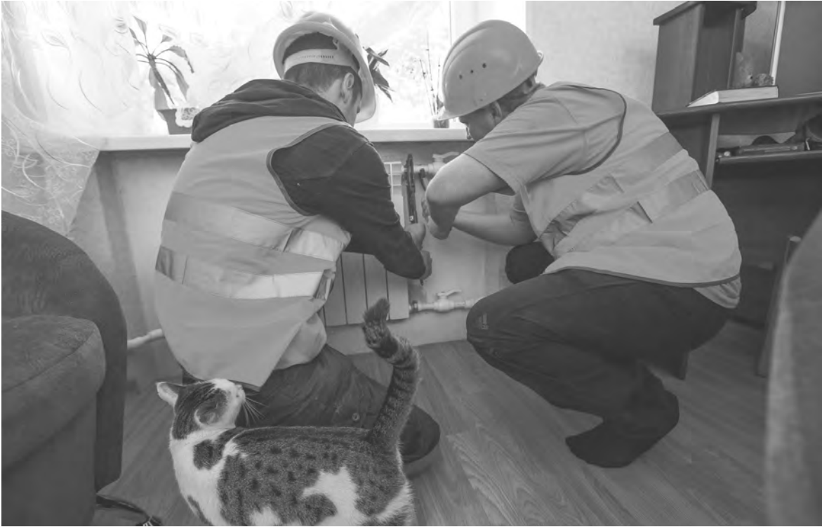
АЛЕКСАНДР ШЕРЯК / ТАСС