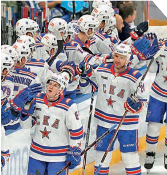
Александр Федоров «СЭ» / Canon EOS-1D X Mark II