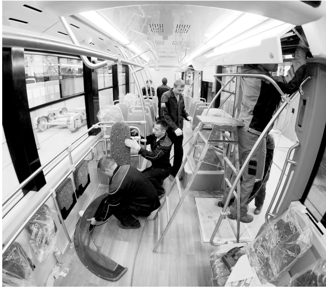
Екатеринбургские трамваи последних моделей отличает эргономичность и комфортность салона.