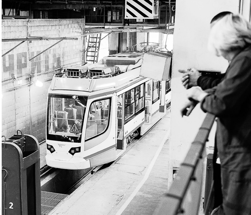
UKV3 сейчас переживает не лучшие времена. Заказ Челябинска мог бы поддержать предприятие.

Так неожиданно комплекующая бросила тень на все изделие, вынужденное уже около месяца стоять на приколе. Во время рабочих рейсов пассажиры отмечали также навязчивые поскрипывающие внутри салона. Что тому причиной и можно ли устранить эти не слишком ласкающие ухо звуки, производители не ответили. В общем, начало испытаний про-