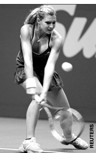
Вчера. Калькутта. Мария КИРИЛЕНКО.

Турнир в Калькутте. Женщины. 1/4 финала. КИРИЛЕНКО (Россия, 4) – Пеннетта (Италия, 7) – 6:3, 6:1. Корытцева (Украина) – Пучек (Белоруссия) – 6:4, 6:2. Кытагонг (Великобритания) – Облитцер (Израиль) – 6:1, 6:3. Хантукова (Словакия, 2) – Чань Юньянь (Тайвань, 8) – 6:4, 6:1.