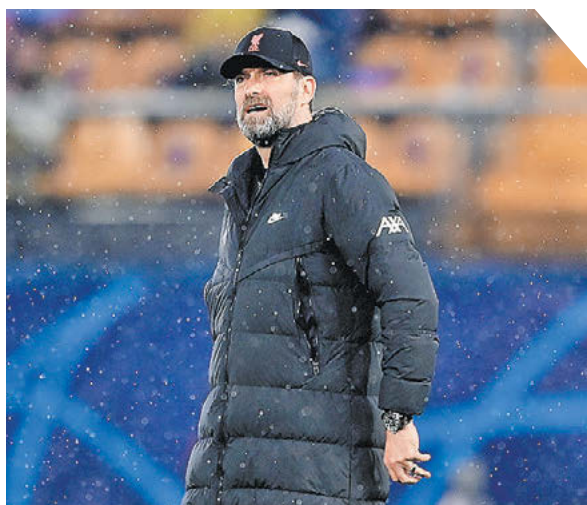
David Ramos Getty Images