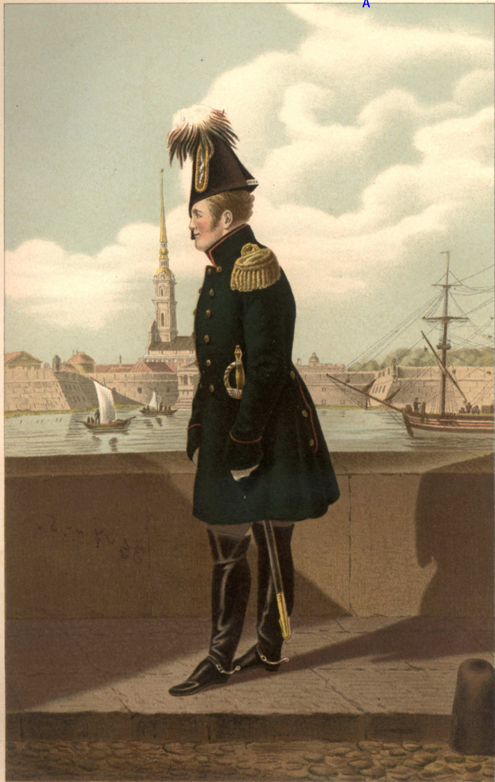
ИМПЕРАТОРЪ АЛЕКСАНДРЪ I.

Съ гравюры Бромлея, отпечатанной красками и сдѣланной съ портрета писаннаго Иглесономъ.