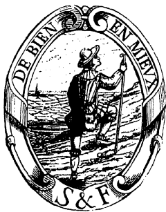
TABLE GÉNÉRALE DES MATIÈRES