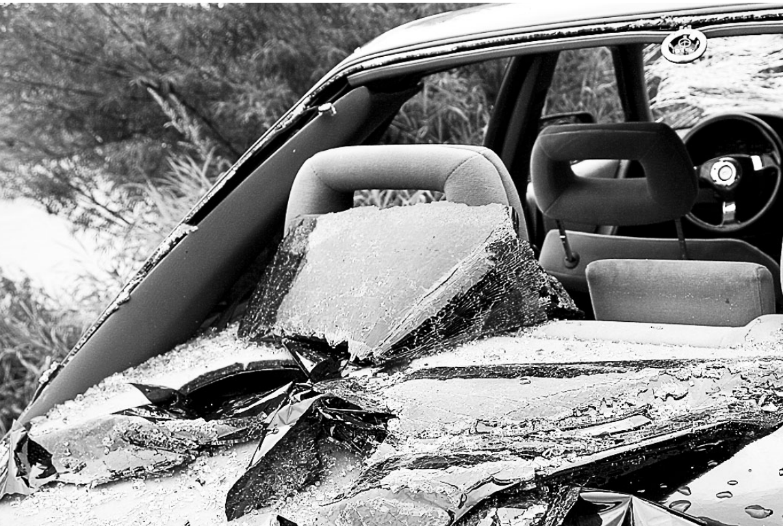
Поводом для боевых действий стала эта разбитая машина