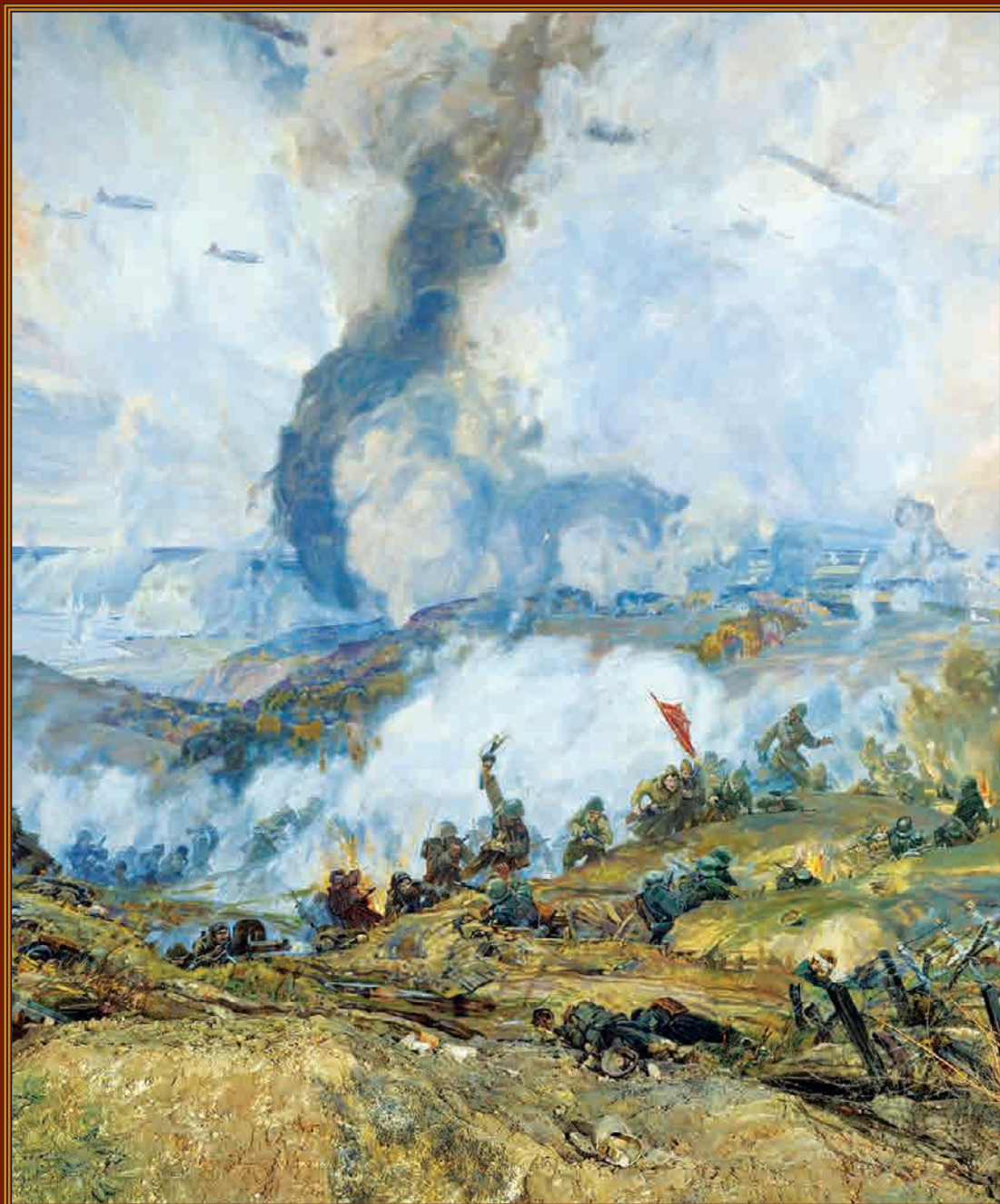
Диорама «Форсирование Днепра»