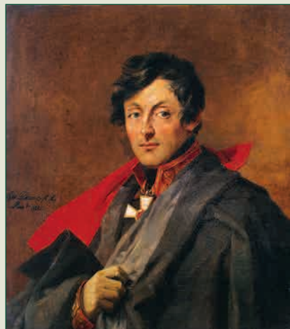
А.И. Остерман-Толстой Художник Джорж Доу, 1825 г. Военная галерея Зимнего Дворца, Государственный Эрмитаж

П ОСЛЕ неудачного для союзников Дрезденского сражения 26—27 (14—15 по ст. ст.) августа 1813 года части союзной Богемской армии начали отступление по горным дорогам в Чехии вблизи селения Кульм (ныне Хлумец). Наполеон направил корпус генерала Д. Вандама (около 37 тыс. человек), чтобы перекрыть пути их отхода. Русский отряд генерал-лейтенанта А.И. Остермана-Толстого (15—17 тыс. человек), прикрывая отход союзной армии, 29 (17) августа неоднократно отбивал атаки превосходящих сил противника. После тяжёлого ранения Остермана-Толстого (пушечным ядром ему оторвало руку) командование отрядом принял генерал-лейтенант А.П. Ермолов.