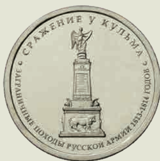
Памятная монета «Сражение у Кульма» из серии «Заграничные походы русской армии 1813—1814 годов» на юбилейных монетах России