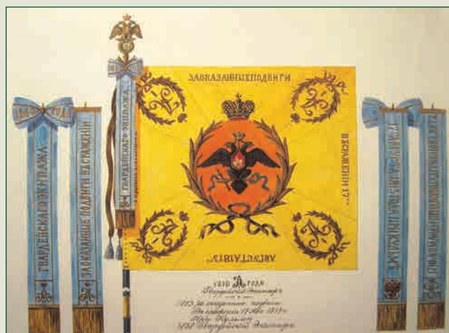
Георгиевское знамя Морского Гвардейского Экипажа с 1813 по 1910 гг. Акварель капитана 2 ранга С.Д. Всеволожского. Из фондов ЦВММ