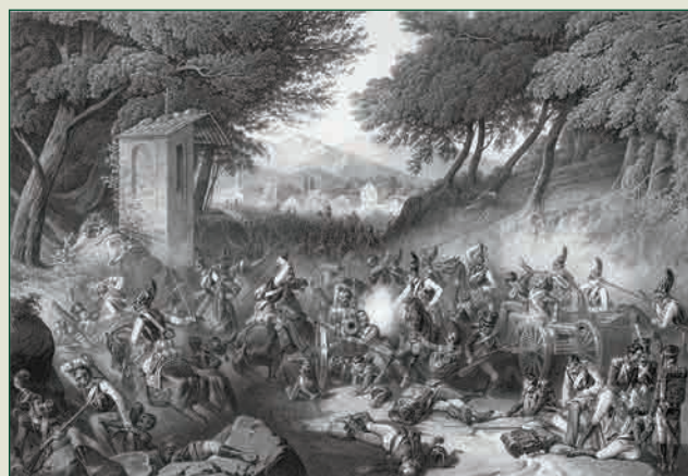
Кульм. 18 августа 1813 года Литография В.К. Ульриха Первая половина XIX в., Государственный Русский музей