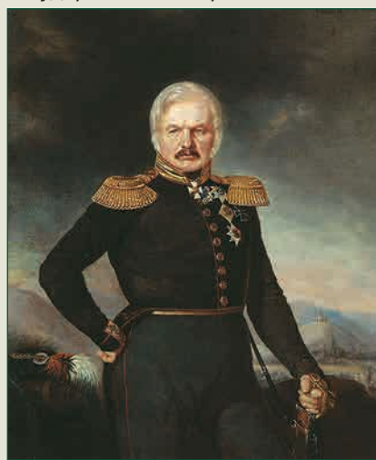
А.П. Ермолов Художник П.З. Захаров, 1843 г.

Прусский король приказал из взятых французских пушек специально отчеканить кульмские кресты и наградить ими всех участников сражения.