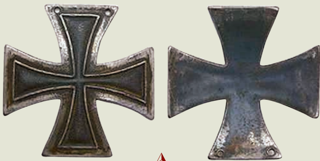
Солдатский железный крест «Знак отличия Железного креста» (Кульмский крест)