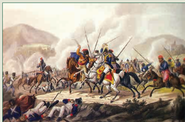
Взятие в плен генерала Д. Вандама в Кульмском сражении Раскрашенная гравюра К.Г. Раля по рисунку И.А. Клейна. Первая четверть XIX в.