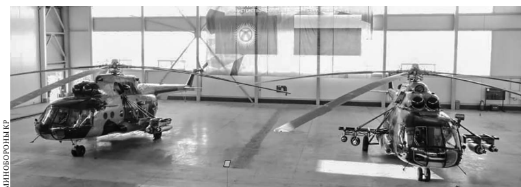
В конце 2019 года Россия безвозмездно передала Кыргызстану два вертолета МИ-8МТ для нужд военных.