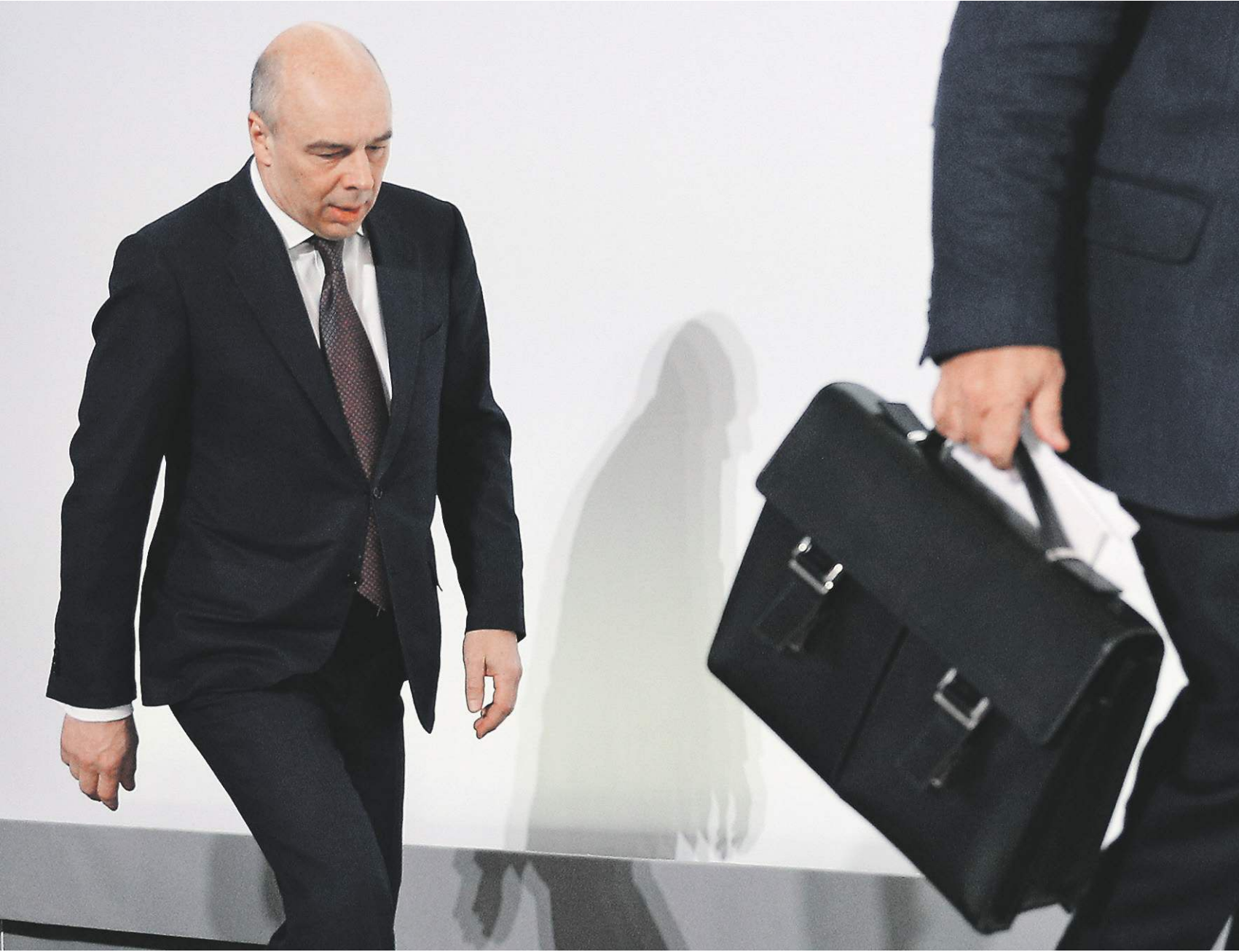
Перед ведомством Антона Силуанова поставлена задача сократить просроченные долги до 23% к 2023 году