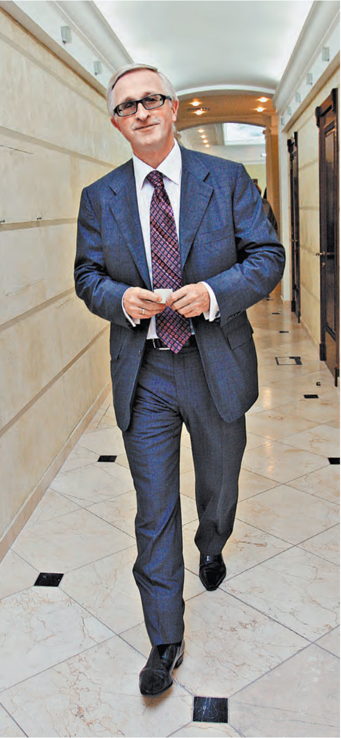
Александр Шохин: Крупный бизнес готов сам взяться за подготовку кадров.

А каковы эти запросы? Александр Шохин: Инновации, прогрессивные технологии, включая цифровые, предъявляют новые требования к персоналу, формируют новый образ труда и ведут к появлению новых профессий или кардинальному изменению основных характеристик существующих. Бизнес заинтересован в радикальных изменениях в сфере профессионального образования. Очевидно, что обновление системы подготовки квалифицированных кадров требуют скорейшей модернизации системы профобу-