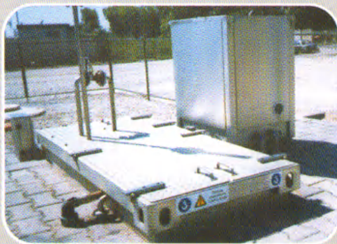
Установка для очистки хозяйственно-бытовых стоков