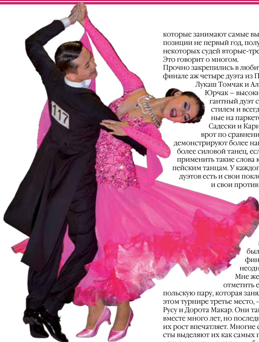
Chong He-Jing Shan, Kumaï

которые занимают самые высокие позиции не первый год, получали от некоторых судей вторые-третьи места. Это говорит о многом.