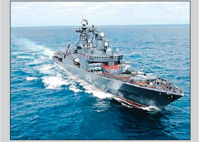
По сообщениям корреспондентов «ВПК», информативности АРМС-ТАСС и Интерфакса-АВН

лись, они были заилены, якорные цепи оборваны. Моряки килекторного судна с помощью водолазов подняли несколько многотонных якорей, удерживающих плавпричал, заменили оборванные цепи на новые и вновь закрепили причалы. Были также восстановлены бетонные покрытия, проведены сварочные и покрасочные работы. Экипаж КИЛ-158 также оказал помощь сотрудникам морской инженерной службы порта в прокладке подводного трубопровода для подачи пресной воды. Пункт материально-технического обеспечения (его прежнее название) в Тартусе создавался в свое время для обеспечения действий ВМФ СССР в Средиземном море и в первую очередь – для ремонта и снабжения кораблей 5-й оперативной (Средиземноморской) эскадры. В Главном штабе ВМФ подтвердили, что Россия не отказалась от планов иметь в будущем пункты базирования своих кораблей также на острове Сокотра (Йемен) и в порту Триполи (Ливия), но «в данный момент в силу различных факторов решено ограничиться Тартусом».