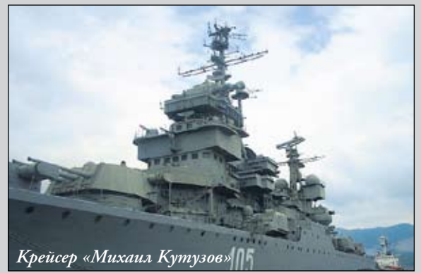
Крейсер «Михаил Кутузов»

командующий войсками Сибирского военного округа. Награжден орденами «За службу Родине в Вооруженных Силах СССР» III степени, «За военные заслуги», многими медалями. Женат, имеет двоих сыновей. Генерал армии Владимир Болдырев, ранее возглавлявший Сухопутные войска, уволен из Вооруженных Сил по достижении предельного возраста.