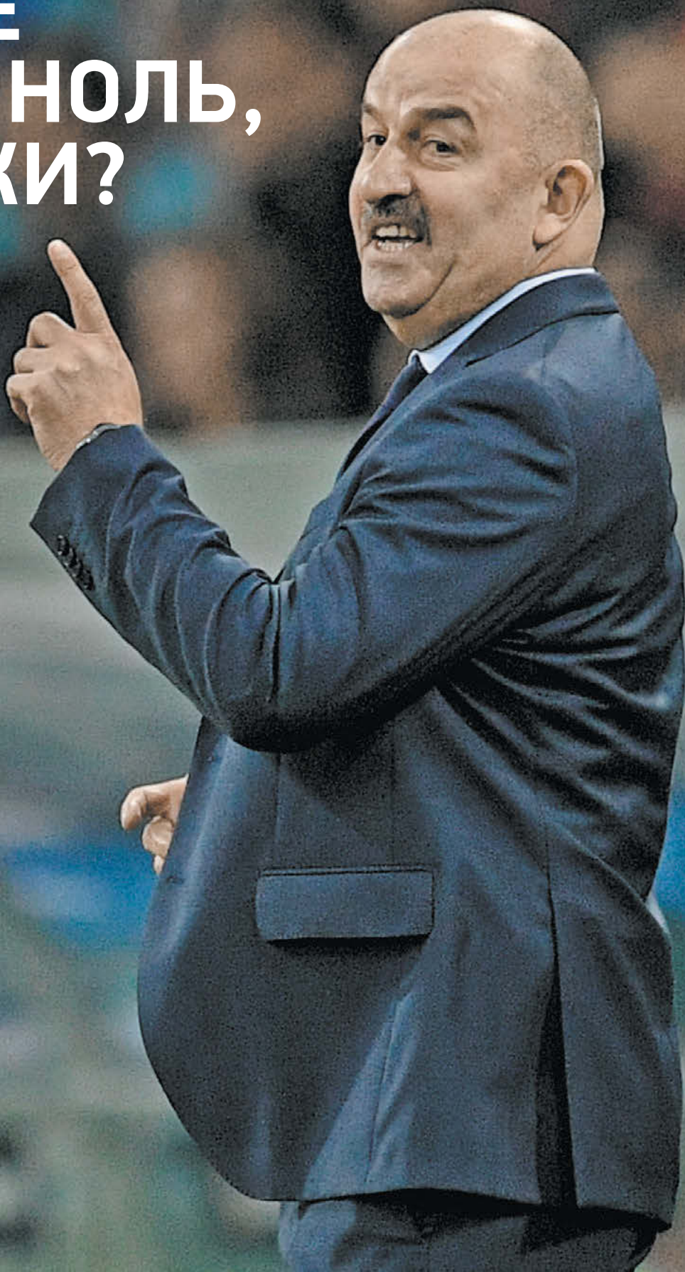
Дарья Исаева «СЭ»

«ГИЛЬЕРМЕ ИГРАЕТ НА НОЛЬ, ГДЕ ОШИБКИ? МОЖЕТ, Я ЧТО-ТО ДРУГОЕ СМОТРЮ?»