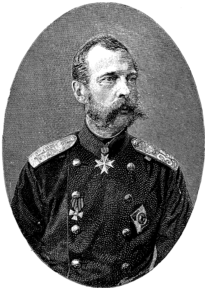
ИМПЕРАТОРЪ АЛЕКСАНДРЪ II.