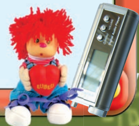
Иллюстрация на обложке: © Disney. All Rights Reserved