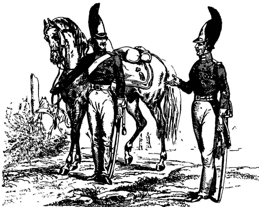
Драгуны русской императорской гвардии. С грав. XIX в.

Художественное оформление, на меловой бумаге.