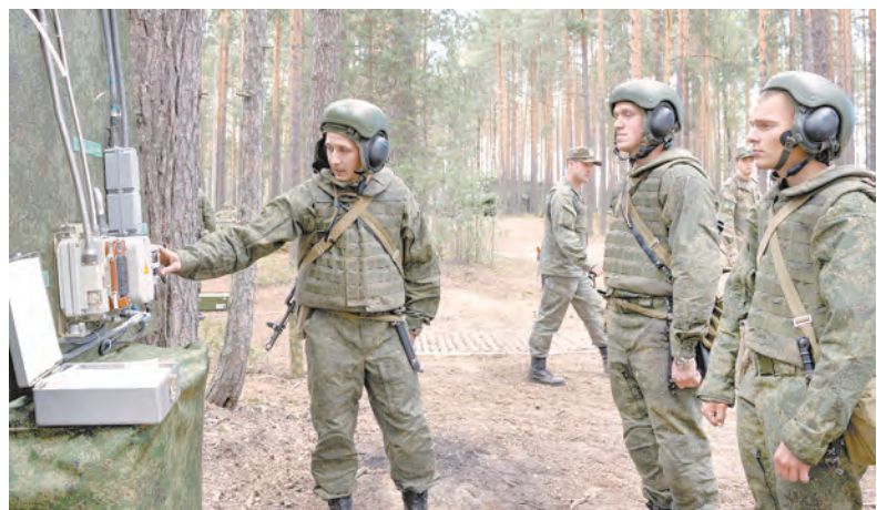
Итоговый успех зависит от качества постановки боевой задачи