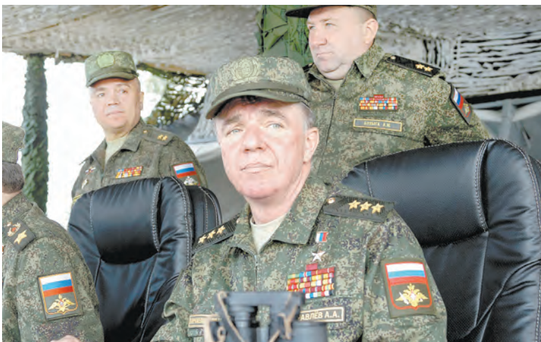
Командующий войсками Западного военного округа генерал-полковник Александр Журавлёв