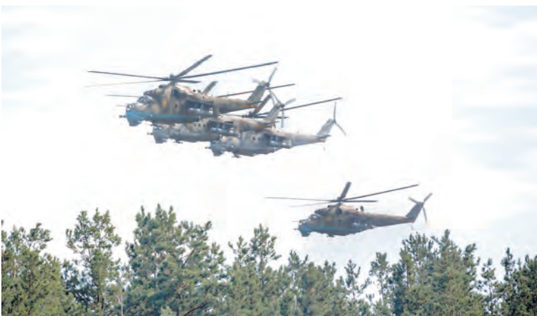
Поддержка выполнения задачи на земле с неба