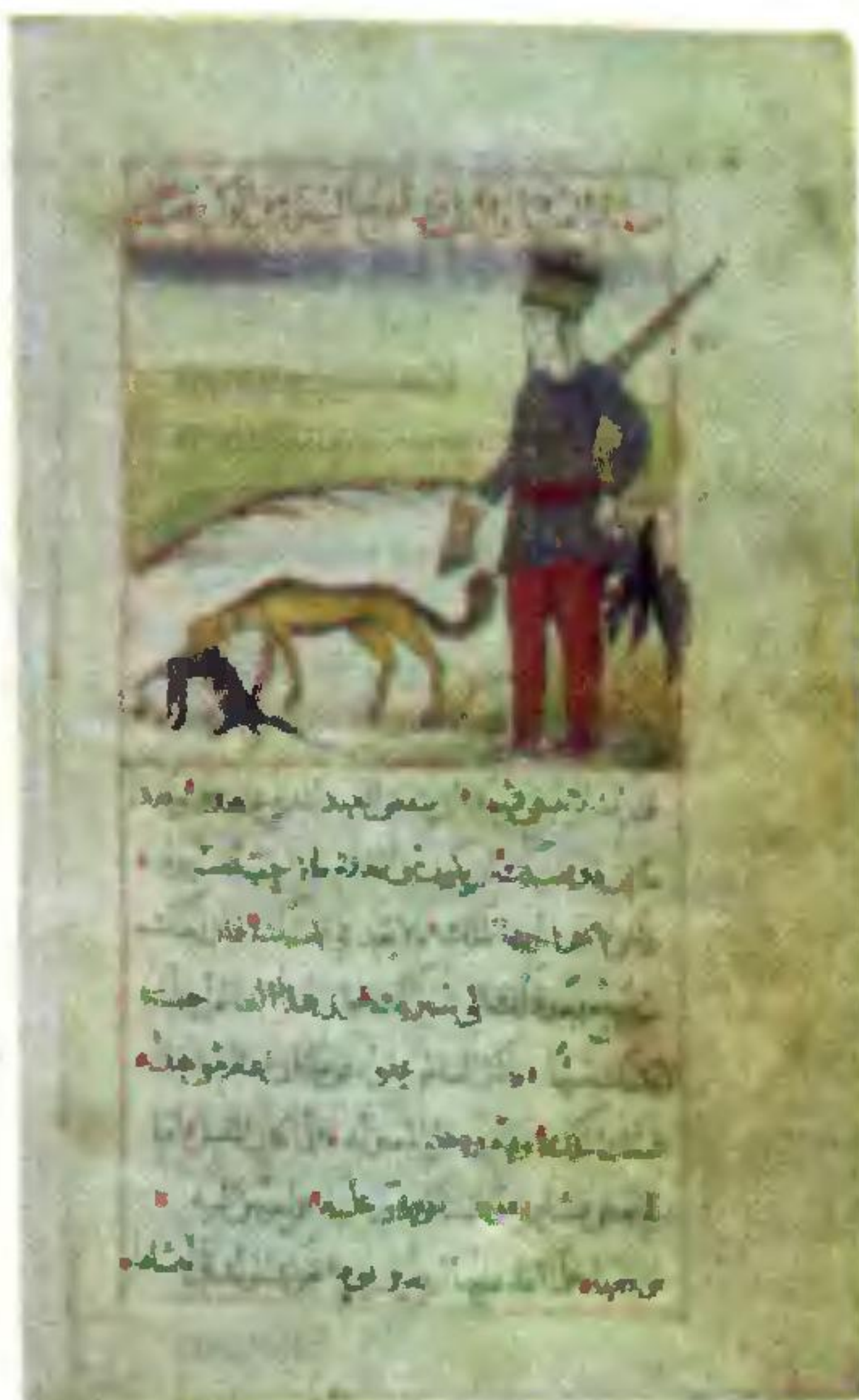
• Европейцы — соавторы «1001 ночи» (стр. 140)