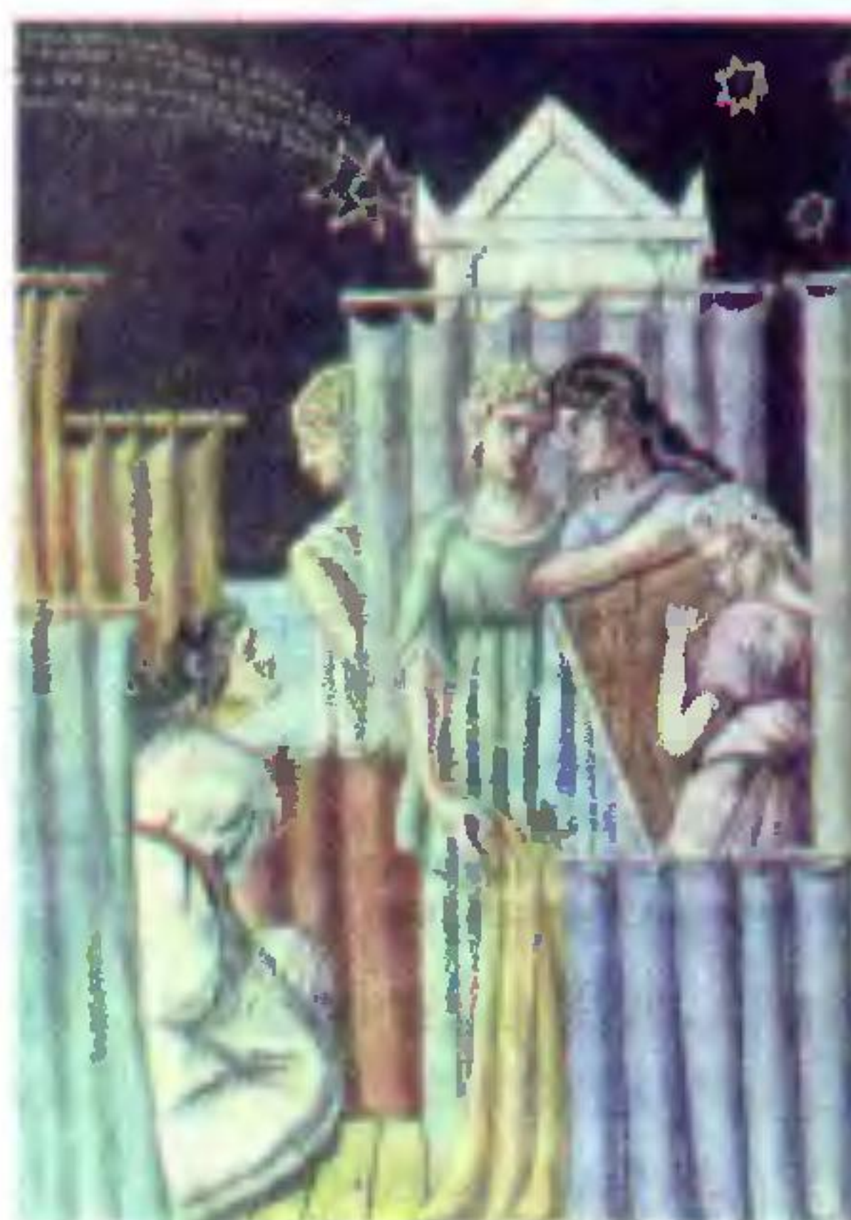
• Джорджо де Кирико. «Предсказатели» (стр. 74)