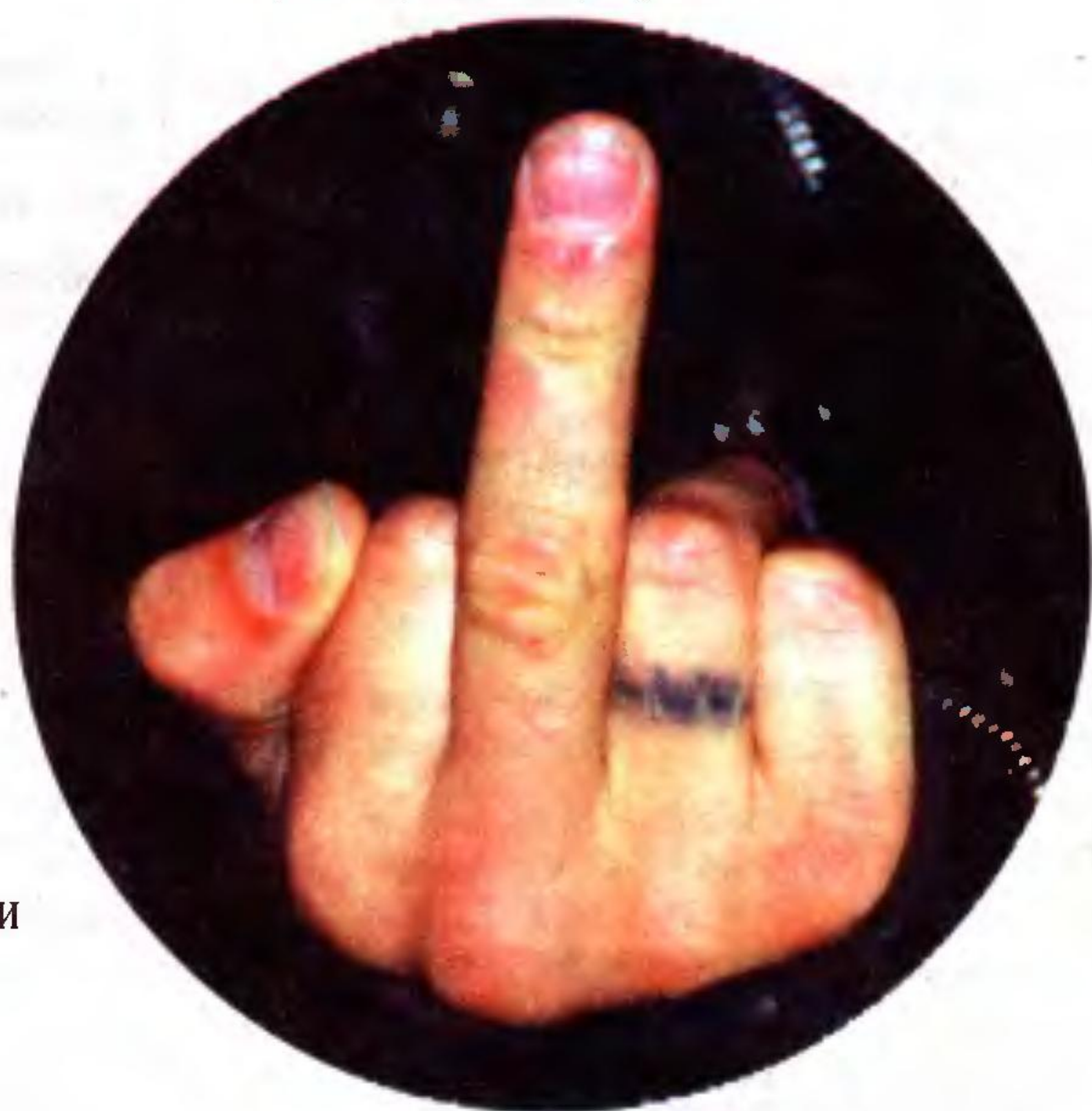
• «Отвратительные, грязные, злые...» (стр. 98)