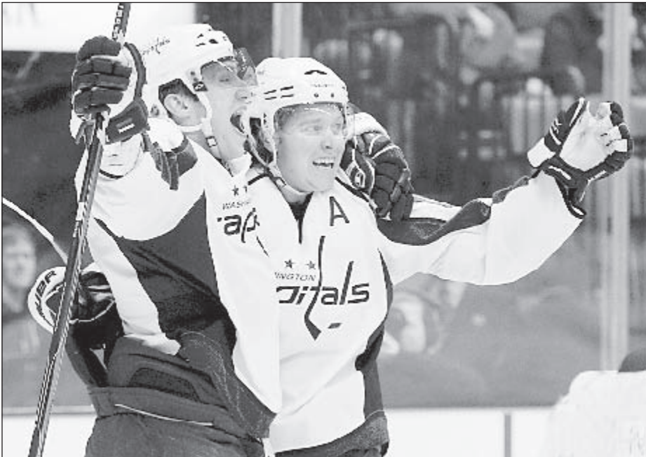
Январь 2011 года. Александр ОВЕЧКИН и Никлас БЭКСТРЕМ (справа) празднуют очередной гол «Вашингтона».

Вчера во второй половине дня в Москву прибыл 24-летний центрфорвард «Вашингтона» Никлас Бэкстрем. Сразу после прилета один из лучших игроков сборной Швеции отправился в офис «Динамо», где поставил подпись под контрактом со столичным клубом.