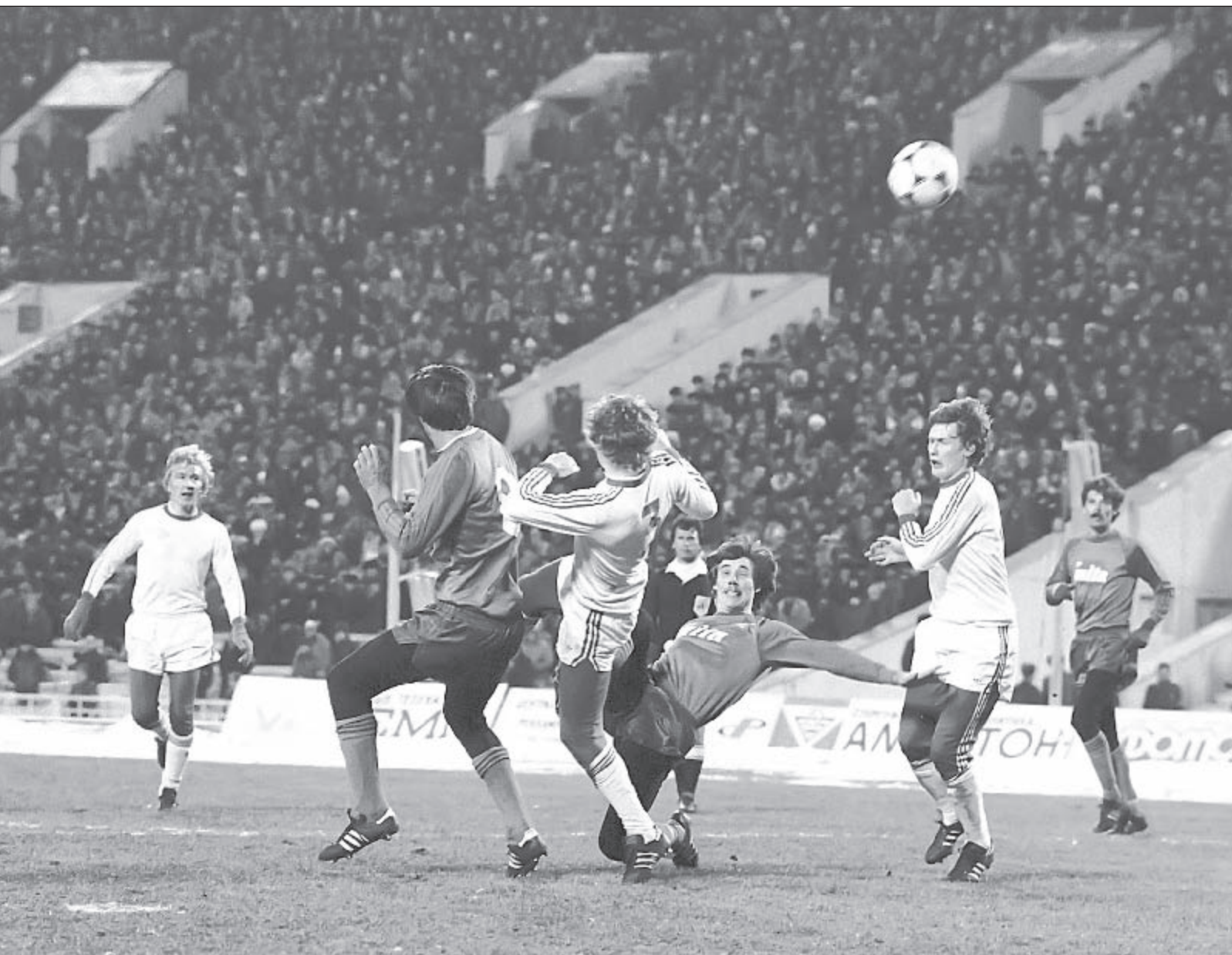
Poppe De Boer

- Не хотели волновать близких? - Не мог поверить в случившееся. Мне казалось, что это был сон... В конце концов я перепрыгнул через мертвецов, вышел на улицу. Там стояла «скорая помощь», штабелем лежали трупы. Мне показало, что их было полсотни. Второе