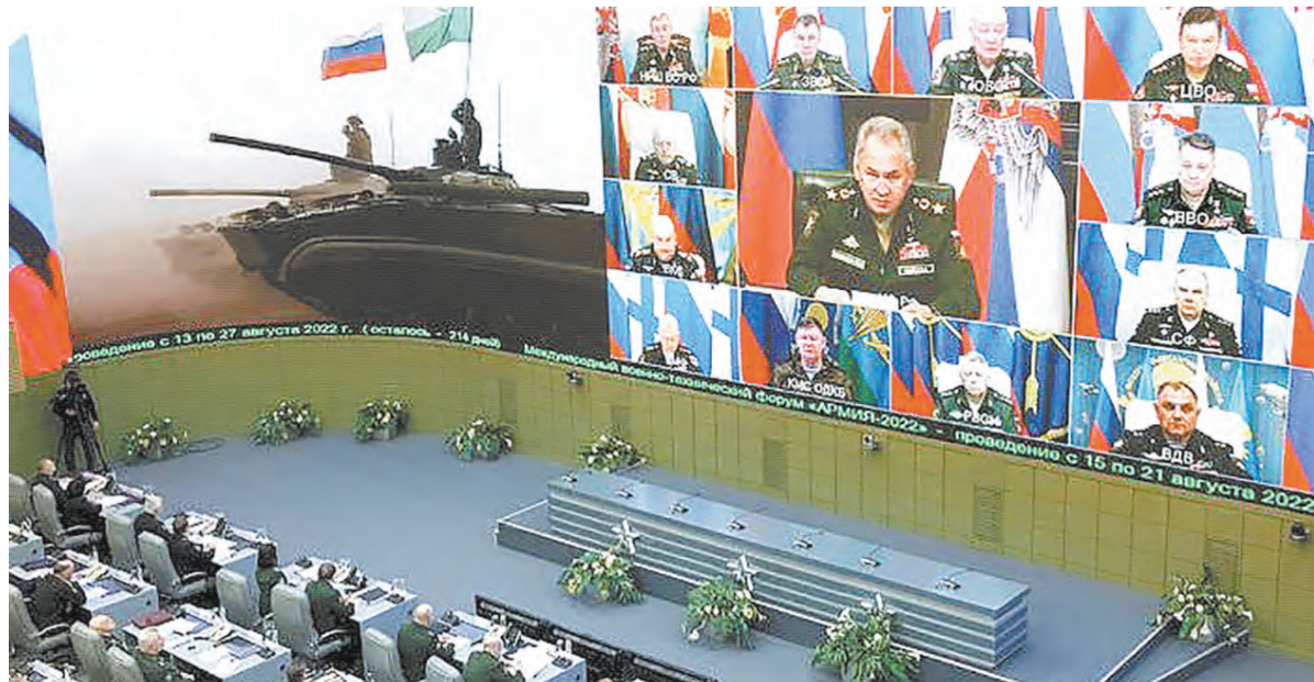
В ходе селекторного совещания были подробно обсуждены планы на 2022 год по ряду основных направлений деятельности Министерства обороны

Как отметил глава военного ведомства России, это стало возможным благодаря высокой слаженности и оперативности действий вооружённых сил государств — членов ОДКБ, достигнутых в результате совместных учений, а также опыта, полученного в ходе развёртывания российских войск в Сирии и миро-