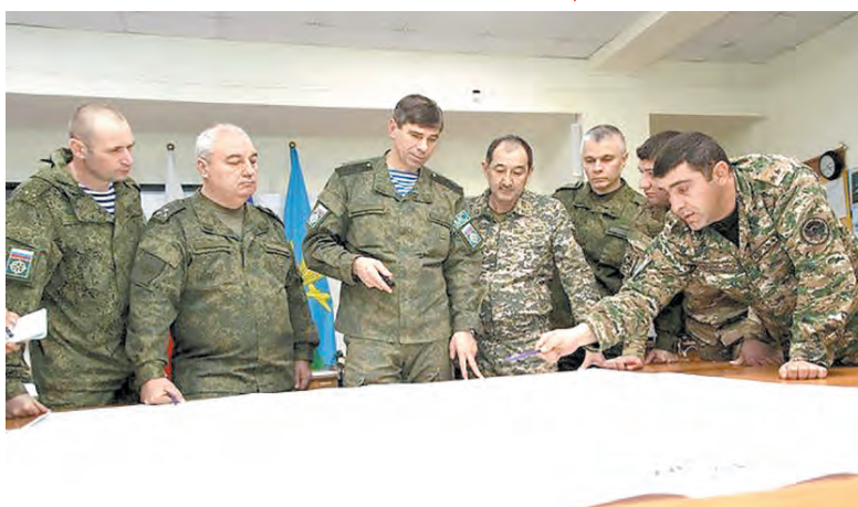
Все решения миротворцы ОДКБ вырабатывали коллективно