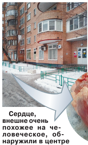
Сердце, внешне очень похожее на человеческое, обнаружили в центре

Москвы вечером 3 марта. Как стало известно «МК», окровавленное сердце прямо перед входом в почтовое отделение на улице Нижняя Красносельская. В полицию позвонила прохожая. Со слов девушки, вероятно, кто-то специально подбросил орган на видном месте, чтобы