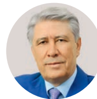
М. А. Эскиндаров Президент Финансового университета при Правительстве РФ