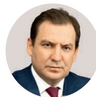
Е. А. Данчиков Министр Правительства Москвы, начальник Главного контрольного управления города Москвы