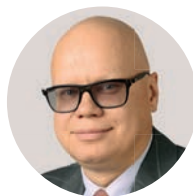
А. М. Лавров Заместитель министра финансов РФ