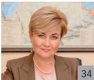
Л. З. ИГДИСАМОВА , заместитель премьер-министра Правительства Республики Башкортостан — министр финансов