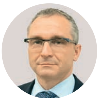
Д. В. Вольвач Заместитель министра экономического развития РФ