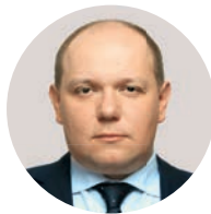
В. А. Зеленский Первый заместитель министра здравоохранения РФ