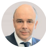
А. Г. Силуанов Министр финансов РФ