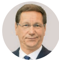
А. Д. Жуков Первый заместитель председателя Государственной думы