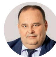
С. Е. Прокофьев Ректор Финансового университета при Правительстве РФ