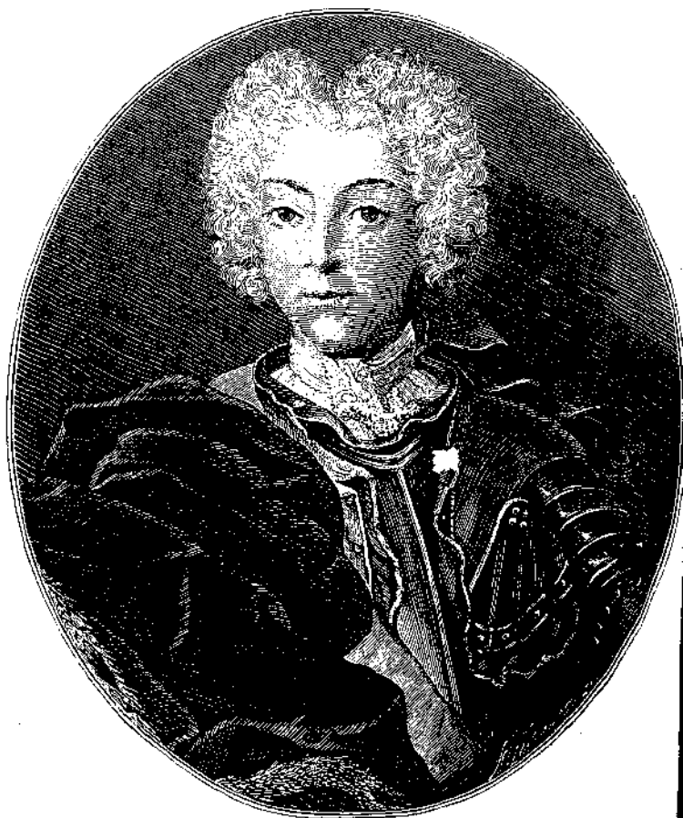
Императоръ ПЕТРЪ II. 1727-1730 г.