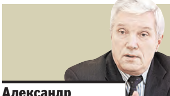
Александр Суриков , посол России в Беларуси:

РОССИЙСКО-БЕЛОРУССКИЕ межгидовские консультации по взаимодействию в рамках международных экономических и финансовых организаций прошли в Москве. Стороны обсудили деятельность МВФ, наметили шаги по продвижению и защите общих интересов. Состоялся обмен мнениями относительно повышения роли России и Беларуси в процессе реформирования деятельности ведущих международных экономических организаций.