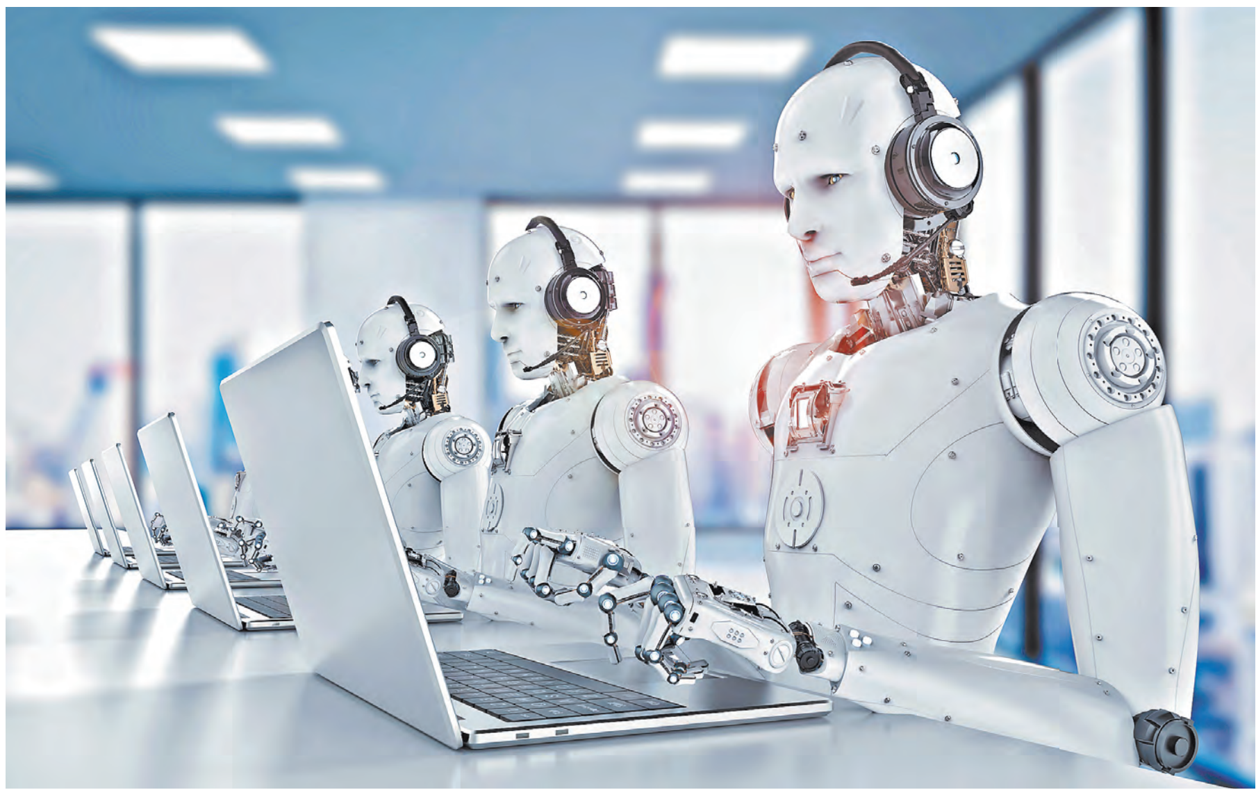
Одними из первых почувствуют на себе неумолимую роботизацию сотрудники колл-центров банков.