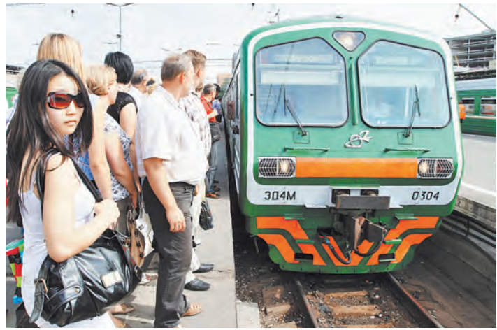
В столичном регионе новая льгота: бесплатный проезд в электричке.

С 1 августа все пенсионеры Москвы и области приняли по просьбам жителей. У многих из них есть дачи, и введение льготного проезда на электричках — это существенная экономия семейного бюджета. Как сообщает сайт мэра Москвы Сергея Собянина, право бесплатного проезда получат 1,1 миллиона москвичей.