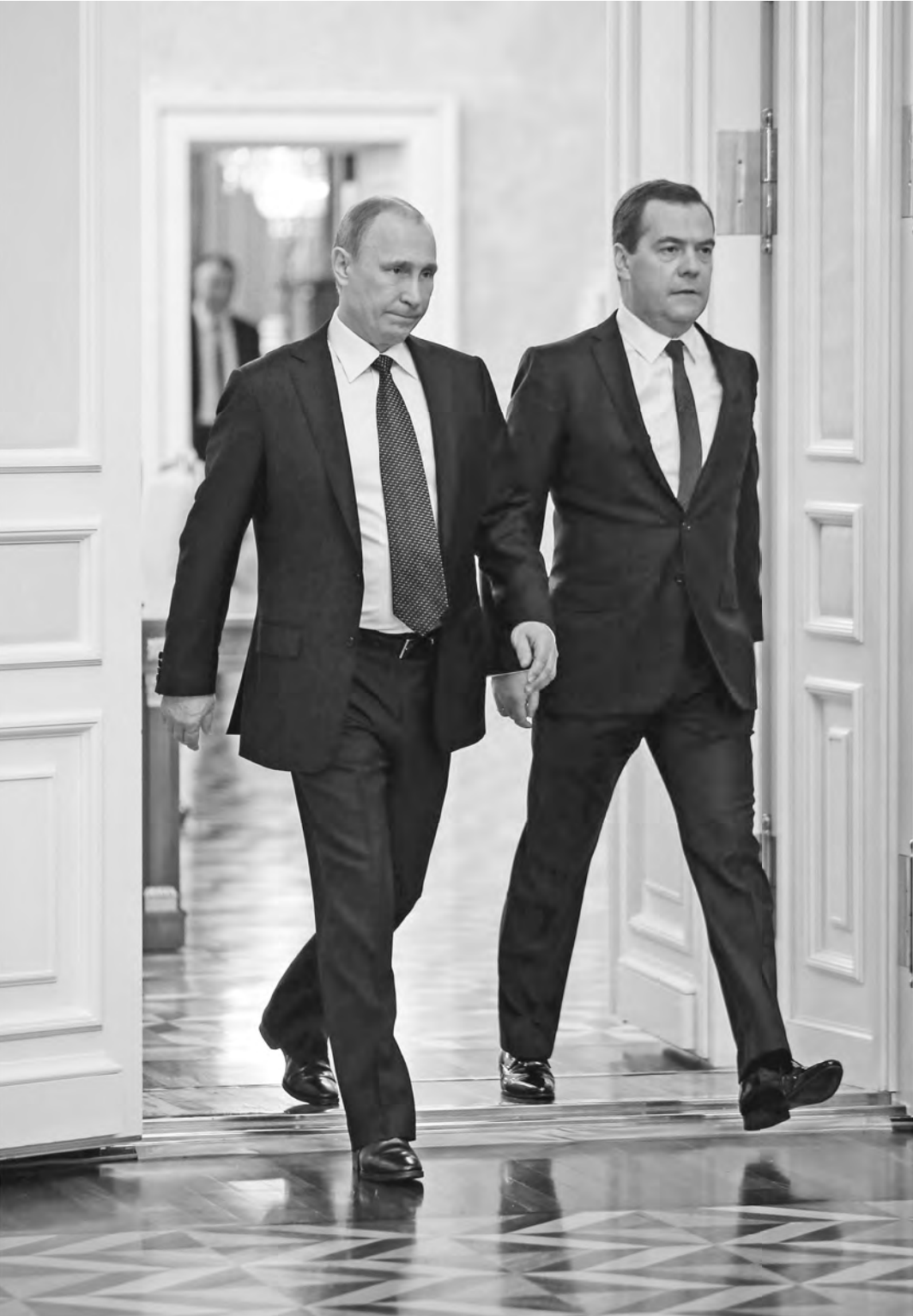
Глава государства приехал в Дом правительства, чтобы оценить работу кабинета министров.

Впереди затяжные праздники, и, возможно, министры, их заместители и сотрудники министерств и ведомств их по праву заслужили, как и остальные граждане. Но, сказал президент, государство сегодня не может позволить им столько отдыхать: «Я прошу вас сосредоточиться на основных направлениях. Основными, безусловно, являются исполнение наших социальных обязательств, решение вопросов, связанных с поддержанием курса национальной валюты».