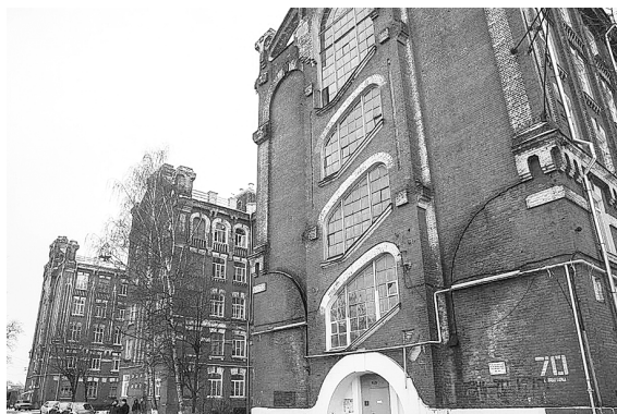
Расселение позволит завершить первый этап реновации Морозовского городка.

Тверской Морозовский городок, или Морозовские казармы, был построен в 1856—1913 годах для «Товарищества Тверской мануфактуры бумажных изделий». Основное развитие квартал получил под руководством знаменитой купеческой династии Морозовых, когда были построены корпуса фабрик, казарм для рабочих и хозяйской постройки из красного кирпича. В составе комплекса более 50 сооружений жилого, общественного и производственного назначения, многие из которых признаны уникальными архитектурными объектами.