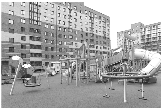
Новый жилой комплекс находится в районе с развитой инфраструктурой.