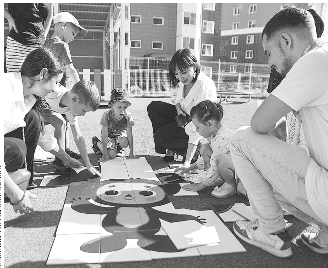
Юным тверитянам новый детский сад понравился сразу.