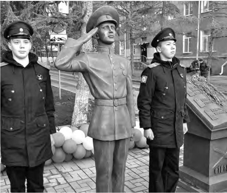
На выправку бронзового кадета равняются сегодняшние воспитанники корпуса.