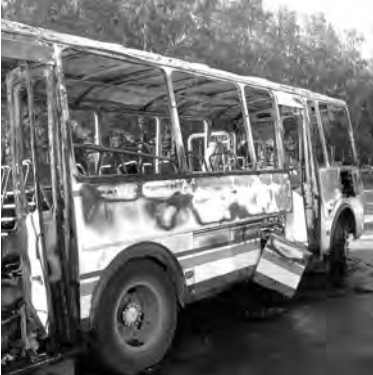
В Кемерове автобус марки «ПАЗ» в считанные минуты превратился в металлолом.