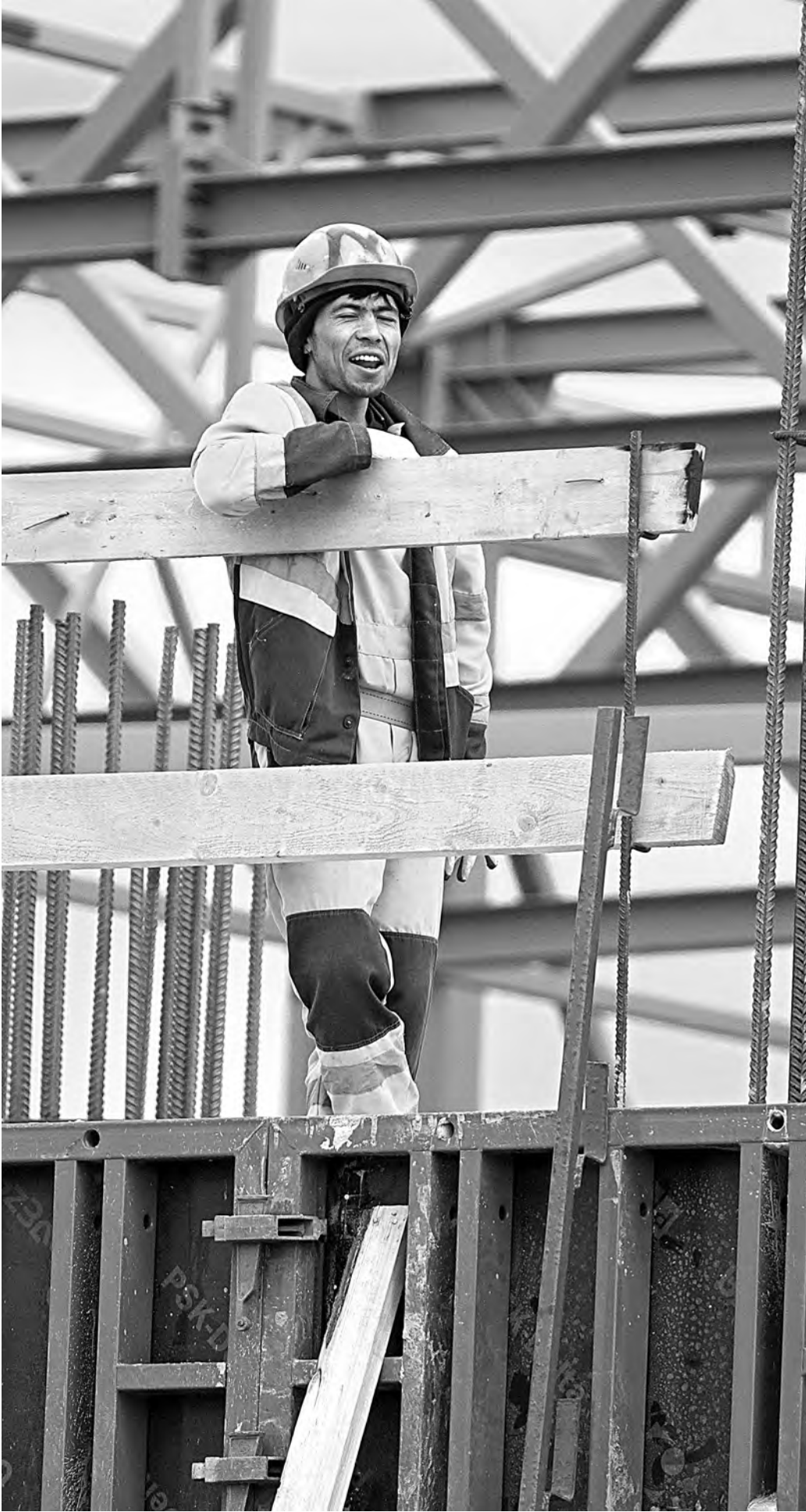
Смягчение условий въезда трудовых мигрантов позволило строительным компаниям решить кадровую проблему.

По данным единой информсистемы, на конец июля в России возводилось 99,4 миллиона квадратных метров. Из них 95 миллионов по 214-ФЗ, что на четыре процента больше показателя июля 2020-го и на десять—января текущего года (минимум последних лет). В лидерах—Воронежская, Тюменская, Кали-