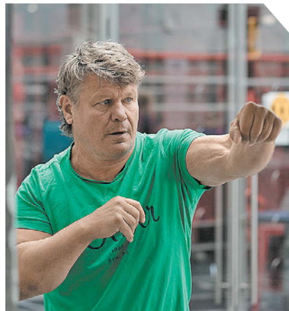
Дмитрий Коротаев «Известия»