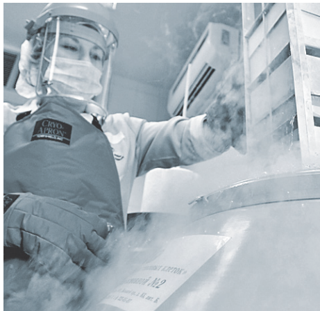
Производство лекарств по GMP требует особой чистоты.