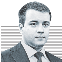
Николай Никифоров, министр связи и массовых коммуникаций РФ: Телекоммуникационная отрасль — один из источников, создающих предпосылки для развития экономики.

Что же предлагают эксперты для того, чтобы разогнать отечественную экономику на долгосрочную перспективу? Специалисты Центра макроэкономического анализа и краткосрочного прогнозирования (ЦМАКП) разработали план развития, содержащий ряд конкретных мер по выводу экономики России из состояния стагнации. Во-первых, это стимули-