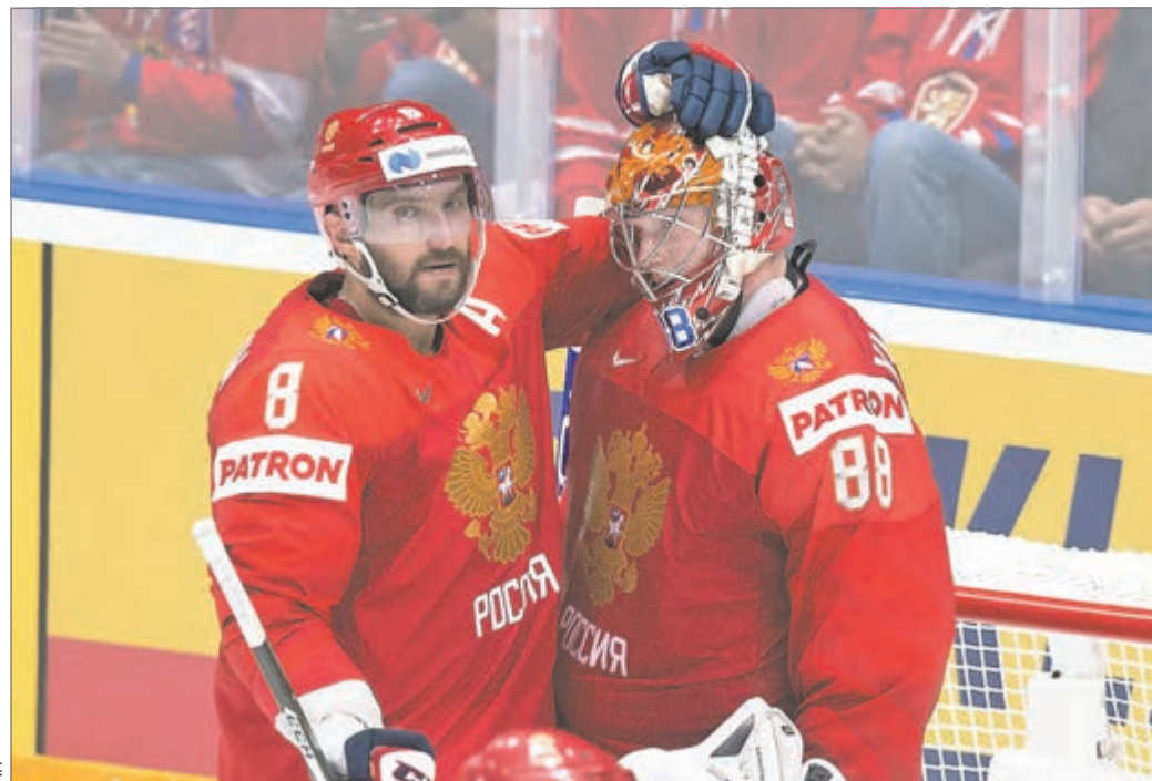
Пятница. Братислава. Россия - Норвегия - 5:2. Одни из лидеров нашей команды - Александр ОВЕЧКИН (слева) и Андрей ВАСИЛЕВСКИЙ.