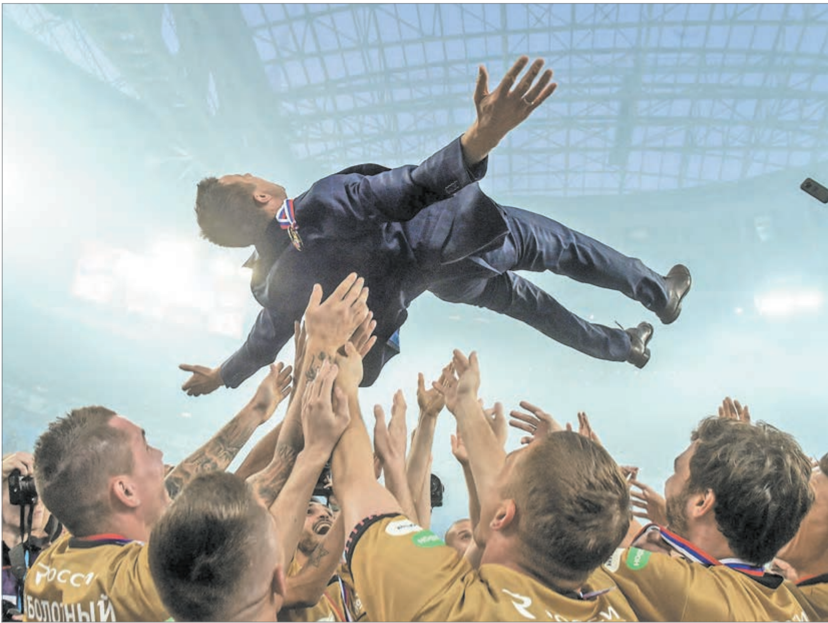
Вчера. Санкт-Петербург. «Зенит» - ЦСКА - 3:1. В воздухе - главный тренер «Зенита» Сергей СЕМАК.

Вчера клуб из Петербурга победил армейцев на своем поле (3:1). После финального свистка сине-бело-голубым были вручены кубок и медали за победу в чемпионате России-2018/19. А вот красно-синих это поражение практически исключило из борьбы за Лигу чемпионов. Команда Виктора Гончаренко пропустила вперед «Спартак», выигравший у «Уфы» (1:0).