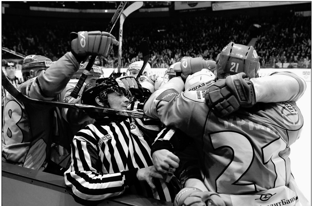
Вчера. Ярославль. «Локомотив» - «Спартак» - 5:1. Безнадежно проигрывая, в третьем периоде гости попытались завести себя, и соперника.